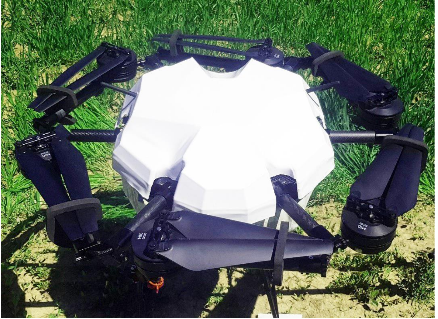
پهپاد سمپاش صبا بعد از انجام عملیات سمپاشی (در حالت بازوهای جمع شده)