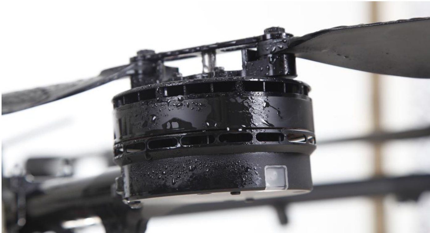
موتورهای براشلس مخصوص همراه با اسپیدکنترل ها و ملخ های تاشونده (ضد آب)